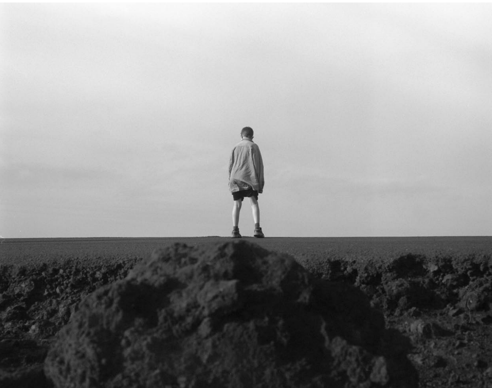
'Uten tittel' Fotografi 145x115cm TOM SANDBERG©2001