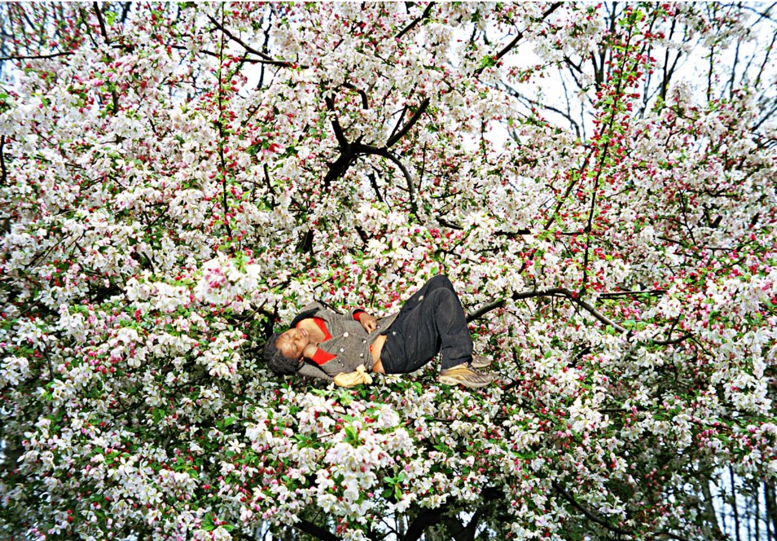
'sleepers' Fotografi 170x120 cm JORUNN IRENE HANSTVEDT©2004