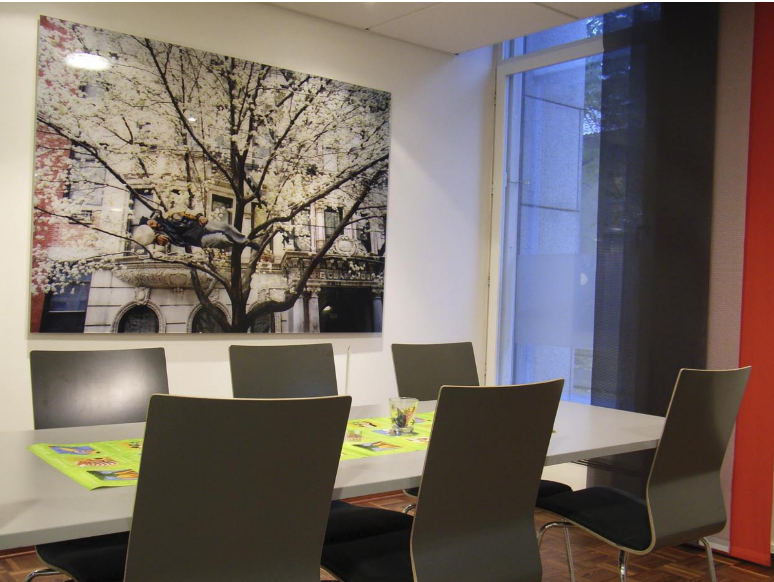
'sleepers' Fotografi 170x120 cm JORUNN IRENE HANSTVEDT©2004