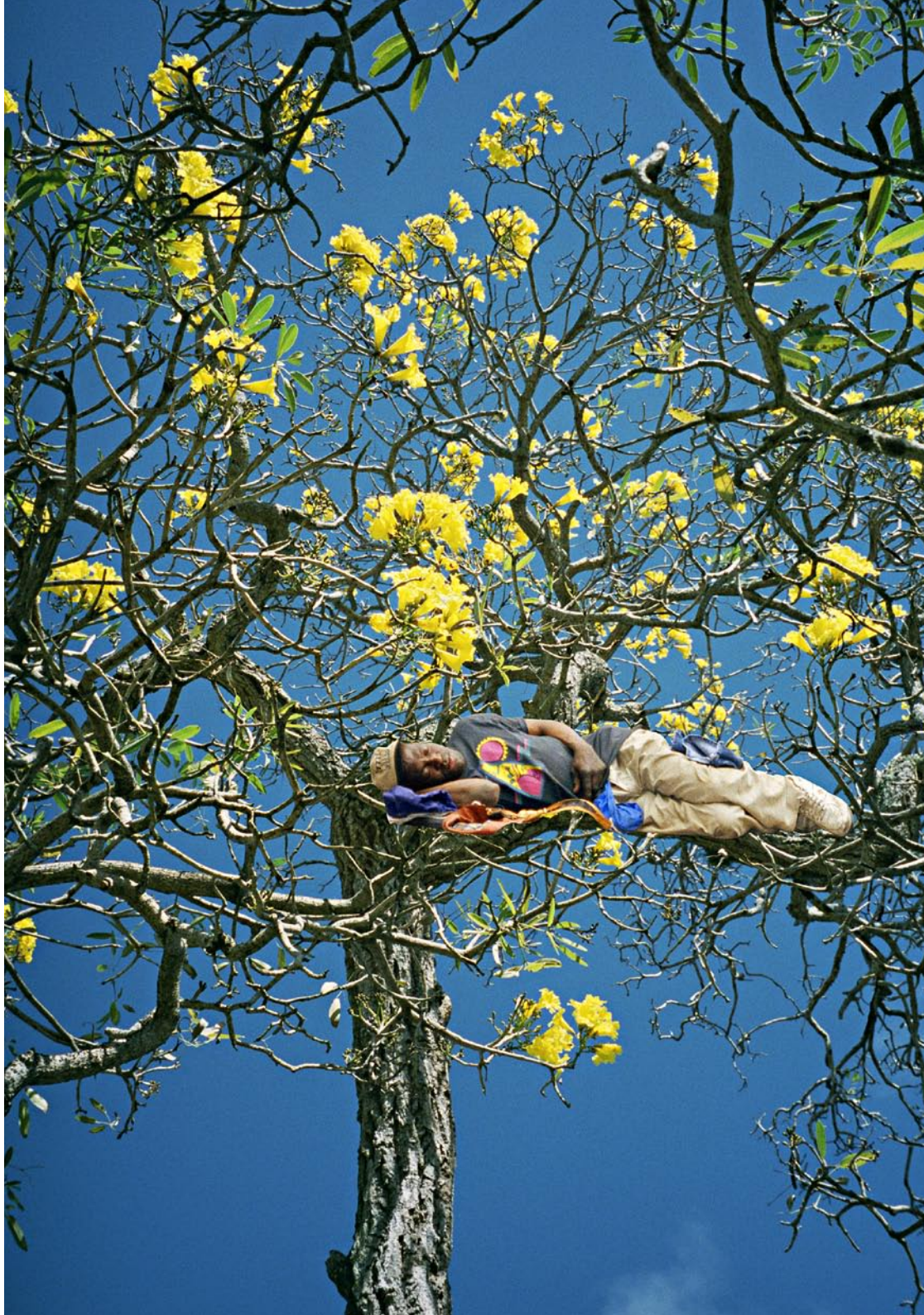
'sleepers' Fotografi 115x165 cm JORUNN IRENE HANSTVEDT ©2004