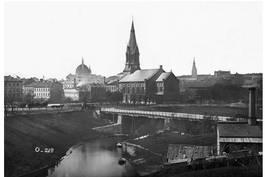
Jakob kirke og Ankerbrua. 1863 – 1883